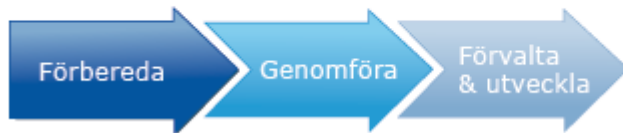
Figur 1. Processbeskrivning för valfrihetssystem enligt LOV

I följande delar beskrivs processen och förutsättningarna för att införa och förvalta ett valfrihetssystem enligt LOV och de aktiviteter som ingår i ett sådant förlopp. Processen för ett valfrihetssystem kan förenklat beskrivas i tre huvudfaser; den förberedande fasen, genomförandefasen och fasen för förvaltning och utveckling av valfrihetssystemet. Faserna är i verkligheten inte statiska i sin position i det ovan beskrivna processflödet. Ofta kan faserna löpa parallellt och även gå in i varandra.